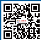
法治安徽网二维码