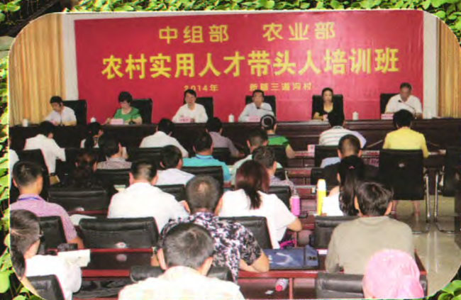
国家农业部农村实用人才带头人培训基地——沙湾县大泉乡三道沟村