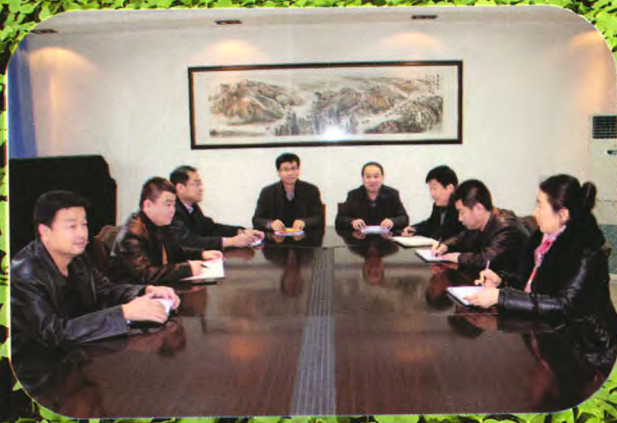
开拓进取的沙湾县农业局领导班子