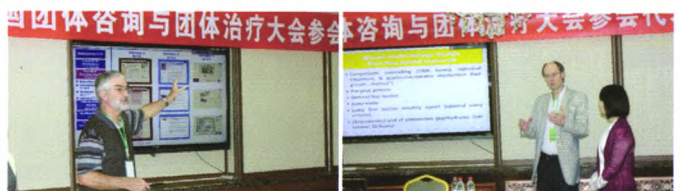
丰富多彩的工作坊