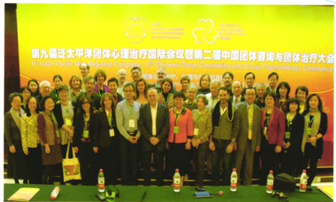
开幕式上专家合影

大会持续了三天,会上共有6个主题报告,29个会中工作坊,19个学术交流分会场,80余篇全国各地的团体心理咨询与团体心理治疗学术论文。来自美国、英国、瑞典、日本、澳大利亚、香港、台湾等19个国家和地区的代表以及来自中国大陆28个省市自治区代表共420余人参会,他们分别来自学校、医疗、军队、企业、监狱和社区等不同领域。在所有参与者中,来自各高校和中小学的老师居多。