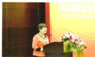
樊富珉教授报告:中国大陆团体咨询与团体治疗:发展、现状与挑战