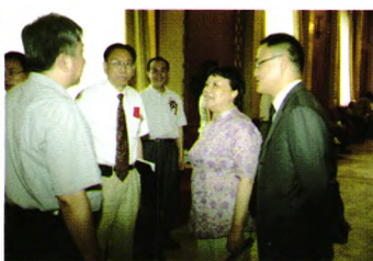
张冉董事长与张侃教授陪同中国科协党组书记邓楠同志接见参会代表