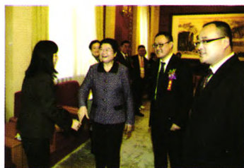
全国人大副委员长顾秀莲同志和张冉董事长一起接见大会嘉宾

大会自举办以来，不仅受到社会各界的广泛关注，也得到相关国家领导人和学术界的高度认可。中国心理学会大会不仅是中国应用心理学事业发展的见证者，也是这一历史进程的参与者和推动者。