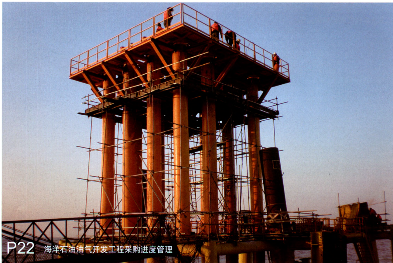
P22 海洋石油油气开发工程采购进度管理