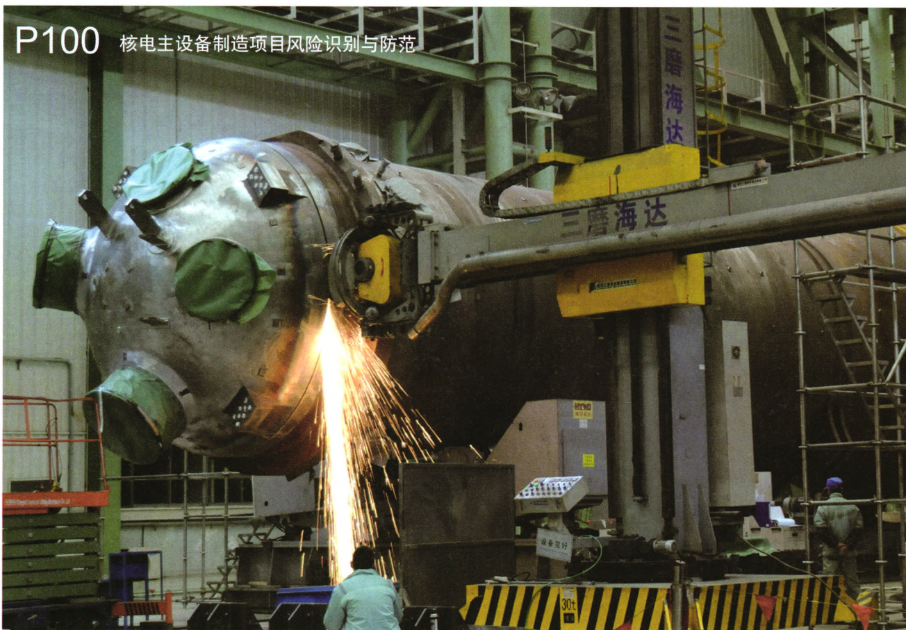
P100 核电主设备制造项目风险识别与防范