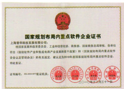
普华科技荣膺“国家规划布局内重点软件企业”

Power 系列软件 —— 融会西方项目管理思想，贯通中国工程管理实务 业主版（PowerPiP）和承包商版（PowerOn）满足工程领域甲乙双方管理之需求，达到项目管理标准化、智能化， 团队运作集成化、协同化，项目型企业经营管理集约化。