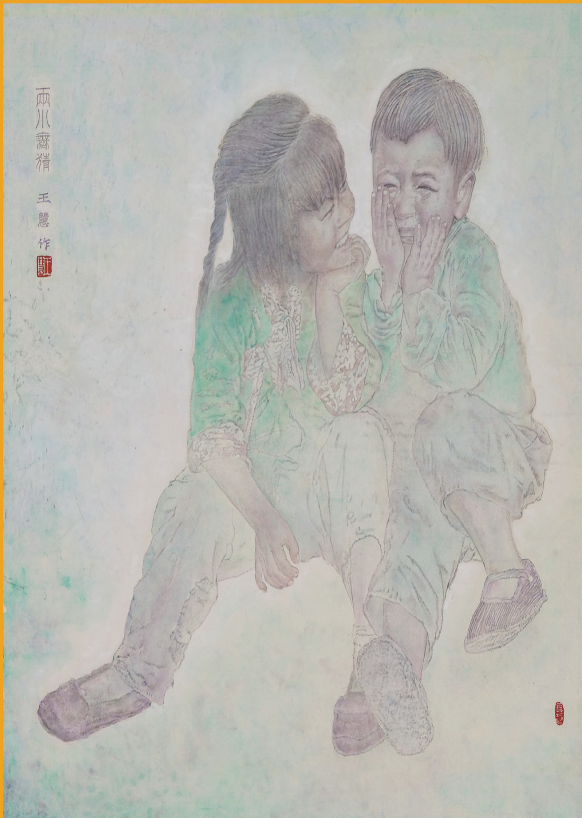
《两小无猜》 92cmx91cm 王慧

现为陕西国画院画家、中国美术家协会会员、北京工笔重彩画会理事。主要参展获奖：《闹社火》入选第十二届全国美术作品展、《月儿》入选中国画学会第一届全国中国画学术展、《绣女·羌族》入选经中华人民共和国文化部批准，于法国巴黎中国文化中心展出的多彩·和谐—中华民族人物风情画展、《陶艺家》获第八届中国工笔画大展优秀奖、《埃尔莎和她的妈妈》入选学院工笔—第二届全国青年工笔画新锐艺术展、《紫荆花》入选第六届中国美术家协会会员中国画精品展、《等待》参加韩国釜山双年展、《梦想》获“微观与精致”——第二届工笔重彩小幅作品艺术展丹青奖、《闺密》入选 2008 造型艺术新人展、《等待》入选第七届中国工笔画大展、《小卓玛和她的朋友》参加“和平颂”长卷搭载神舟七号活动、《祈祷》入选全国小幅工笔重彩作品展、《紫荆花》入选世纪伟业——中国绘画艺术特展，分别在香港和北京展出、《塔吉克小姑娘》获第六届全国工笔画大展铜奖、《带手机的女孩》《月夜》参加“中国画画世界——埃及印象”作品展、《高原上的姑娘们》入选纪念抗日战争胜利六十周年全国中国画作品展、《青春》入选第二届全国少数民族美术作品展、《小憩》入选第二届中国人物画展——纪念蒋兆和诞辰一百周年、《晨》获纪念延安文艺座谈会讲话发表 60 周年全国美展优秀作品奖。