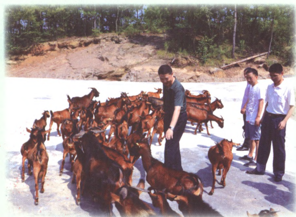
南江黄羊是南江特色产业之一，为促进特色产业的规模化、产业化、现代化发展，联社负责人在五郎黄羊合作社专题调研并积极开发信贷产品支持产业发展。