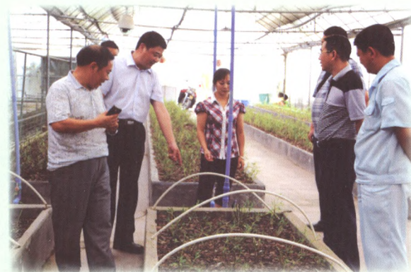
联社负责人在集中药材生产、经营、研发于一体的百草中药材有限公司调研信贷需求，并通过对该公司的信贷支持，带动中药材种植专业合作社的发展。