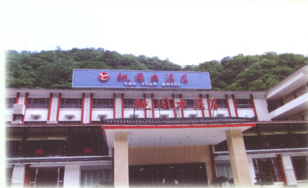
积极支持观光旅游业发展。图为南江县联社信贷支持的集食宿、康体、娱乐、会议、旅游、商务为一体的桃园大酒店。