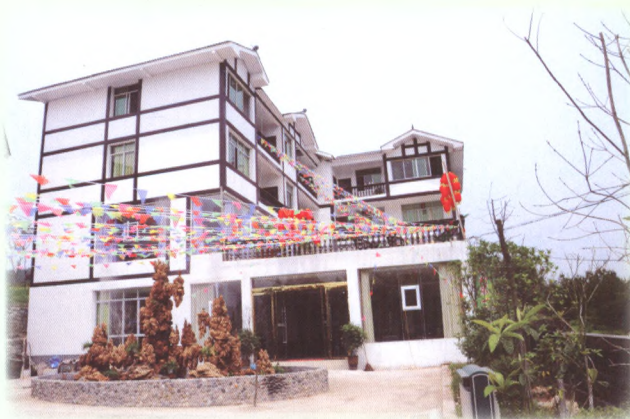
联社与县融资担保公司合作，创新融资担保方式，积极支持大学生创业，建起农家乐。