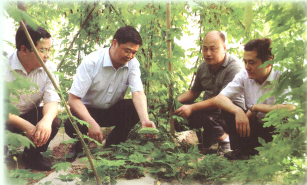
联社负责人在东榆镇槐树村蔬菜专业合作社调研。