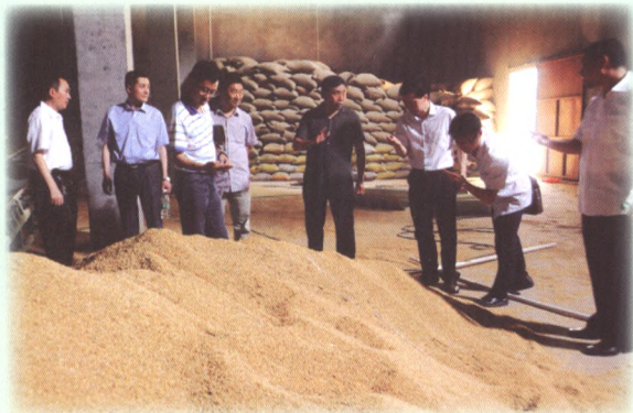
联社负责人在光雾山米业调研。