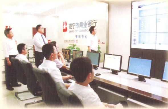
遂宁市商业银行加大信息科技投入，建成高标准数据中心。