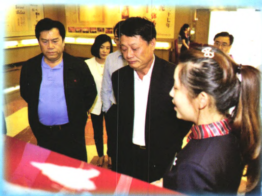
▲ 民生银行党委书记、行长洪崎（中）前往五粮液集团参观调研白酒特色业务。