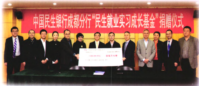
▲ 2011年民生银行成都分行在西南财经大学设立“民生就业实习成长基金”并累计向该基金捐赠200万元。图为2013年11月21日成都分行第三次向“民生就业实习成长基金”注入爱心。