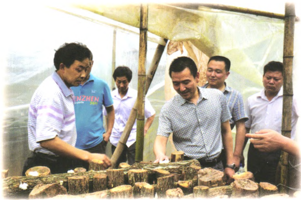
通江联社理事长（右三）深入银耳种植大户调研。