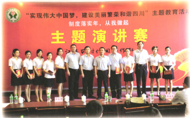
“实现伟大中国梦，建设美丽繁荣和谐四川”主题演讲赛。