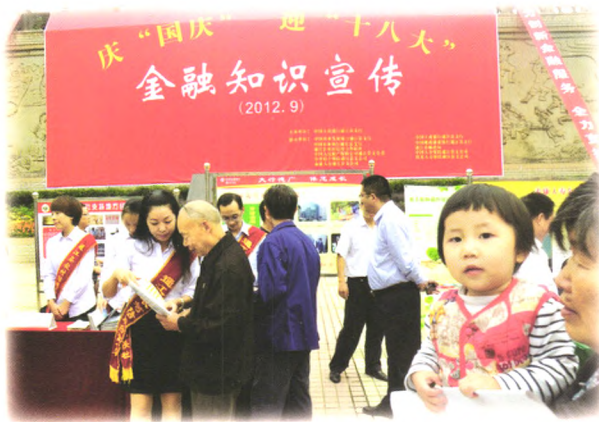
开展庆国庆、迎十八大金融知识宣传。

面对未来，通江农信社将继续秉承“敢于担当，踏实守信，荣辱与共，奋勇争先”的农信精神，以组建农村商业银行为契机，以发展为主线，以改革为动力，不断提升管理水平，强化内控执行，明晰产权制度，完善法人治理，依法、合规、稳健经营，充分发挥农村金融主力军作用；努力打造机制灵活、管理规范、服务一流的现代农村金融企业，为地方经济的全面协调发展作出新的贡献。