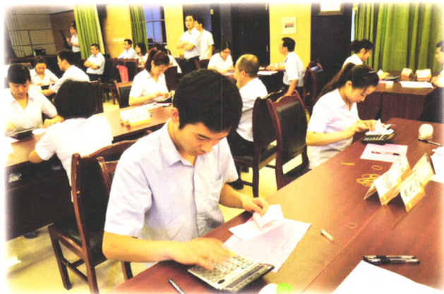
开展员工岗位技能竞赛。