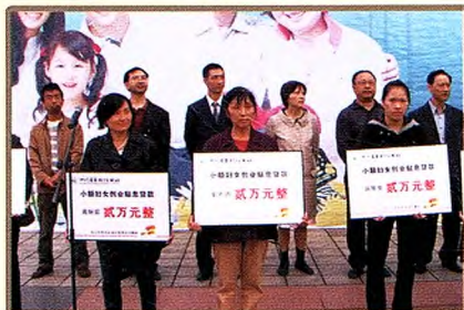
市中区联社在改妇女小额创业担保贷款启动仪式上为15名妇女现场发放贷款