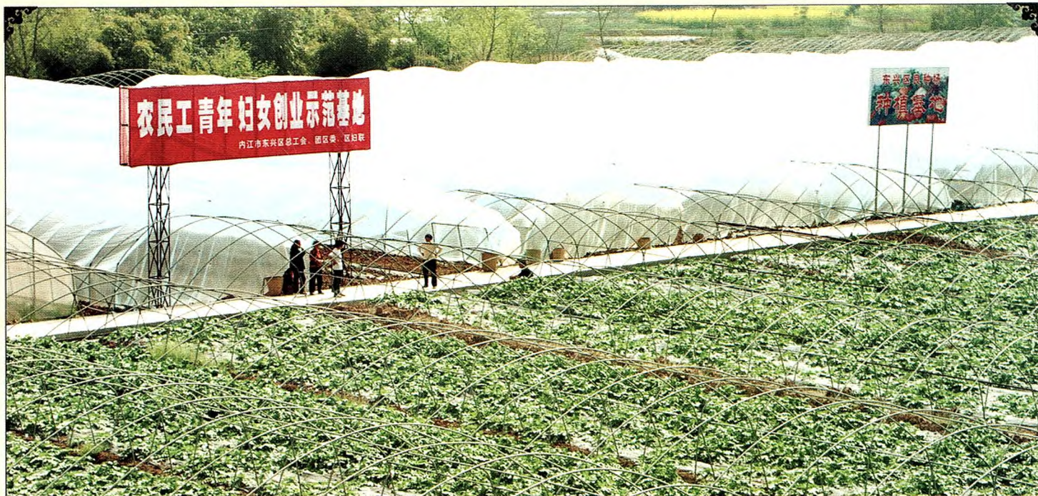
东兴区联社支持生态观光园区建设