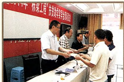
省联社内江办事处支持2014“栋梁工程”为26名学子现场发放扶贫助学金