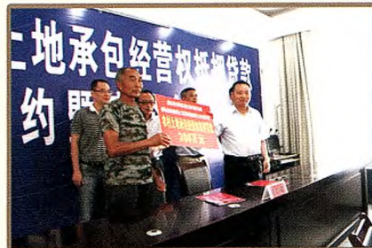
威远县联社发放全市第一笔土地承包经营权抵押贷款

内江市农村信用社充分发挥农村金融主力军作用，坚持服务“三农”、服务小微企业、服务县域经济的市场定位，坚定不移地加大对三农、小微企业、弱势群体和县域经济的金融支持，在深化改革、加快发展、防范风险的同时，主动履行各项社会责任，力争成为依法经营、优质服务、关注民生、传承文化、推动发展和促进和谐的表率，加快建设最具社会责任的普惠银行。