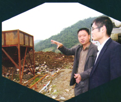
芦山农信社在灾后重建时期贷款470万元扶持新建的互惠砂石厂。

2013年4月20日，四川省芦山县发生7.0级地震。灾情发生后，芦山县农村信用合作联社在四川省农村信用联社和县委、县政府领导下，积极投入当地灾后重建工作。截至2014年末，芦山县农村信用合作联社共计投入76725万元支持灾后重建，其中，发放15634万元，支持22个灾后重建项目的资金需求，发放农房灾后重建家园贷款10904户，金额59533万元，发放城房灾后重建家园贷款260户，金额1558万元。有力地支持了芦山县灾后的生产恢复、受灾群众安置安居以及重大灾后重建项目的建设，发挥了金融在灾后重建工作中的巨大支持作用。