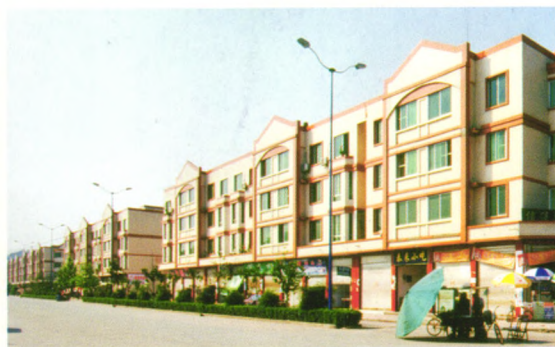
射洪农商银行支持的新农村建设成效显著。