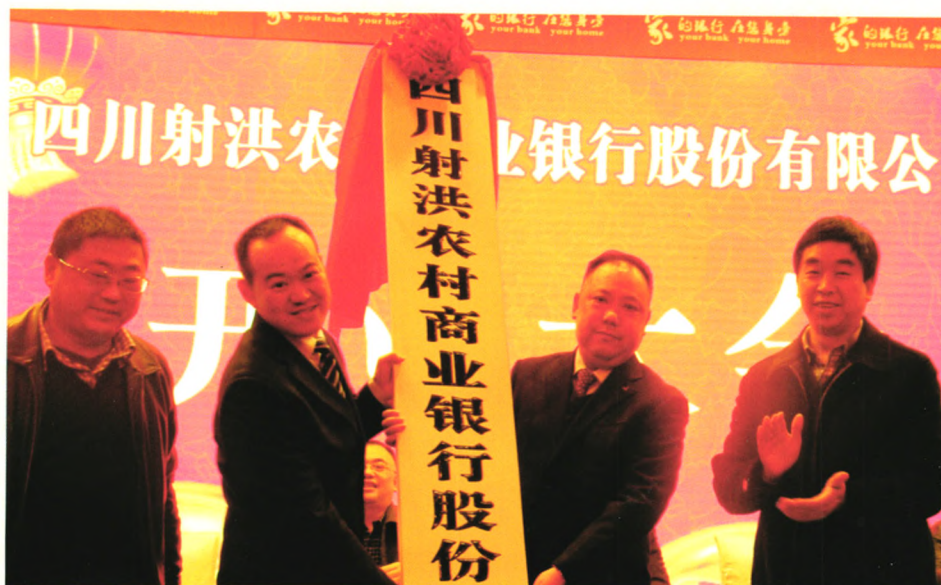
射洪农商银行开业。

四川射洪农村商业银行股份有限公司（简称“射洪农商银行”）是在有着62年历史的原射洪县农村信用合作联社基础上转型升级成立的现代商业银行。2015年12月4日，射洪农商银行正式挂牌开业。