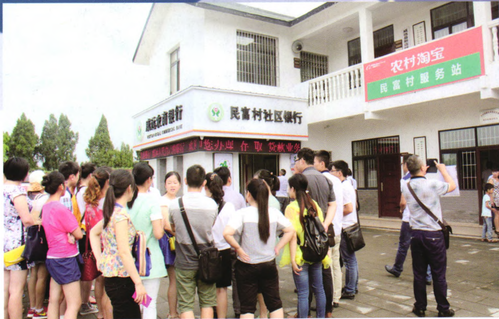
威远农商银行民富村农村社区银行

四川威远农村商业银行股份有限公司（以下简称威远农商银行）前身是威远县农村信用社，经过改制后于2014年12月5日正式挂牌开业，成为内江市首家农村商业银行。