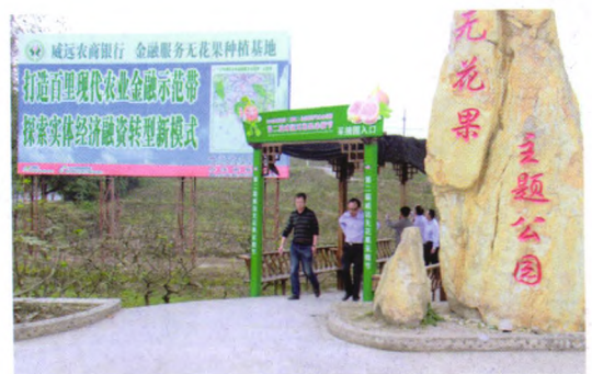
威远农商银行百里金融示范带无花果基地