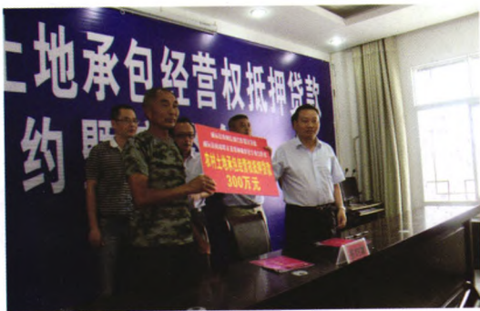
内江市第一笔土地承包经营权抵押贷款

威远农商银行一直秉持承办最具社会责任感的银行宗旨，向扶贫济困、捐资助学、抗震救灾、公益事业、对口支援等爱心事业捐款近千万元；积极履行纳税责任，连续多年被评为内江市企业纳税大户。2015年，威远农商银行被四川省财政厅评为经营AAA级单位，在全省银行类金融机构中处于优秀水平。