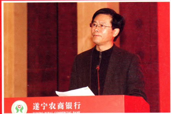
▲遂宁市委副书记、市长杨自力讲话