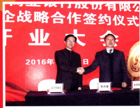
▲省联社与遂宁市人民政府签订银政战略合作协议

遂宁农村商业银行股份有限公司（以下简称“遂宁农商银行”）是在遂宁市遂州农村信用合作联社基础上，经中国银行业监督管理委员会四川监管局2016年11月30日批准，2016年12月6日工商登记，依法设立的城区农村商业银行。历经60余年的发展变革，遂宁农商银行始终坚持“服务‘三农’，服务中小微企业，服务区域经济发展”的市场定位，现已发展成为遂宁市普惠民生的金融主力军、连接城乡的金融主纽带、支持区域经济发展的金融主引擎。