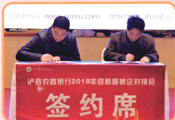
2018年2月1日，泸县农商银行与企业签订战略合作协议。