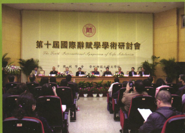
学院举办的“第十届国际辞赋学学术研讨会”