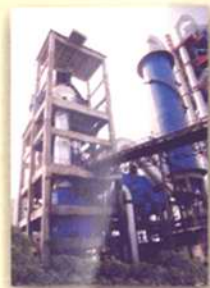
青海新型建材工贸有限责任公司生料辊压机终粉磨系统

成都院通过多年的研制工作和工程实践已经形成了辊压机系列产品, 在工程应用中取得了较好的业绩, 其可靠性和技术指标在同类产品中都处于先进水平。青海新型建材工贸有限责任公司生料辊压机终粉磨系统是成都院在充分发挥辊压机产品优势的基础上, 根据其原料性能进行优化配置的节能工艺。目前, 该系统运转可靠、操作简便, 在产品细度满足熟料烧成系统要求的条件下, 系统平均产量超过180 t/h, 各项指标均达到国内外先进水平。