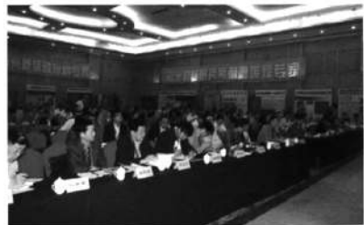
第四届中国水泥工业耐磨材料技术研讨会会场

以“交流抗磨经验,展示耐磨技术,提高应用水平,促进供需合作”为主题的“中国水泥工业耐磨材料技术研讨会”自2005年策划举办以来,已先后在成都、郑州、无锡和昆明成功举办四届,是中国建材机械工业协会耐磨材料及抗磨技术分会和新世纪水泥导报杂志社联合精心打造的水泥界与耐磨界的技术交流平台。该平台已得到水泥企业、水泥装备制造和耐磨材料供应商的广泛认可。主办方表示,在以往几届的经验之上,将把“第五届中国水泥工业耐磨材料技术研讨会”办得更好。