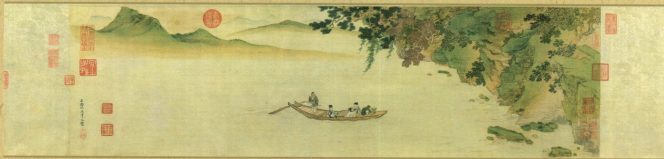
《赤壁图卷》 绢本设色 26.1×292.1cm 辽宁省博物馆藏