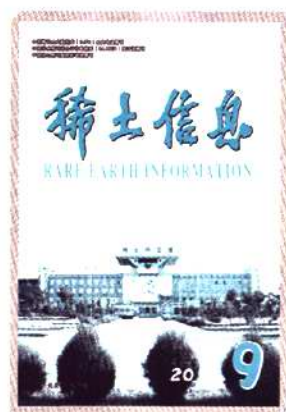
第 9 期封面