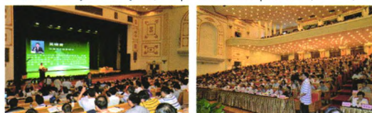
► 2013年中国环境科学学会学术年会主会场

2.《中国环境科学》继续位居环境科学技术、安全科学技术类科技期刊前列,核心影响因子1.523,学科排名第1;在被统计的1998种核心期刊中,影响因子列第18位,并获得“百种中国杰出学术期刊”称号。