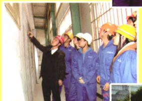
教师在实训基地授课