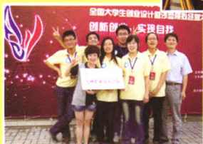
2012年获得第六届“用友杯”全国大学生创业设计暨沙盘模拟经营大赛江苏赛区金奖、全国银奖