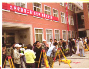
“徐光杯”测量实训大赛