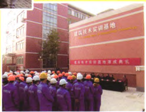
建筑技术实训基地落成典礼