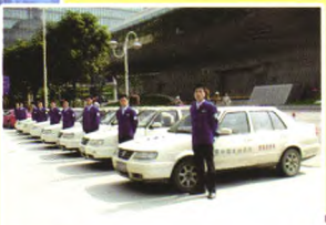
汽车运用技术(汽车事故评估与理赔)订单班,入学即签就业服务协议

九州职业技术学院创建于1993年,是一所具有独立颁发国家承认大专文凭资格的全日制省属民办高校。学院位于江苏省徐州市泉山风景区,办学规模较大,师资力量雄厚,招生与就业两旺。学院累计投资3亿元,校舍建筑面积15万平方米,教学、实训、生活和文体设施配套齐全。