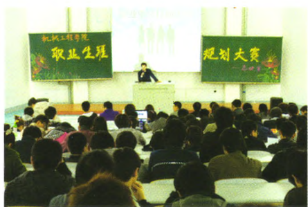
机械学院职业生涯规划大赛