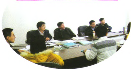
文法学院班导师工作总结考核测评会