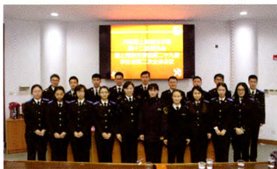
学院第十二次团代会暨学代会