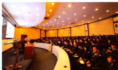
第十期团校开班仪式