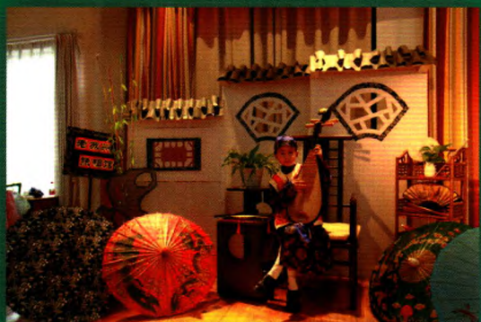
“韵味苏州”六一自主体验活动-1