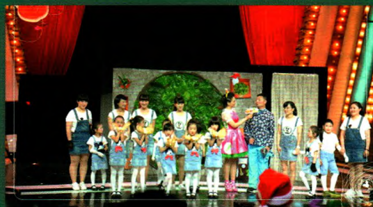
养蚕节目参加央视少儿《看我72变》栏目演出