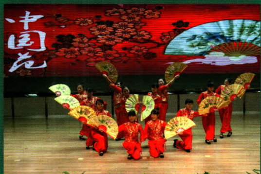
教师健身舞蹈比赛一等奖