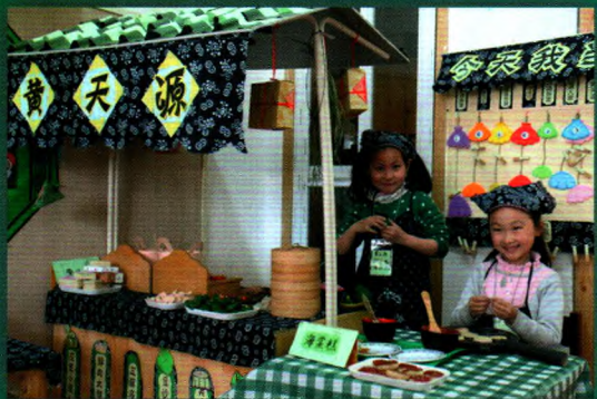
“韵味苏州”六一自主体验活动-2

苏州高新区新升幼儿园创建于1996年,2001年8月评审为江苏省示范性实验幼儿园。园舍占地面积6300平米,建筑面积4712平米,绿化覆盖面积为1380平方米。园内四季花香,环境整洁优美,教学设备先进,是江苏省绿色幼儿园。全园教职工敬业爱岗、乐于奉献、勇于实践、敢于创新,涌现出一大批优秀骨干教师。