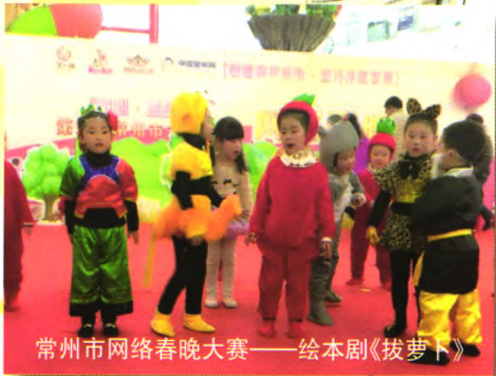
常州市网络春晚大赛——绘本剧《拔萝卜》