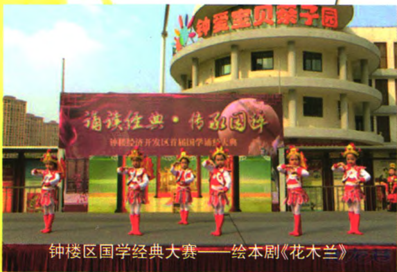
钟楼区国学经典大赛——绘本剧《花木兰》