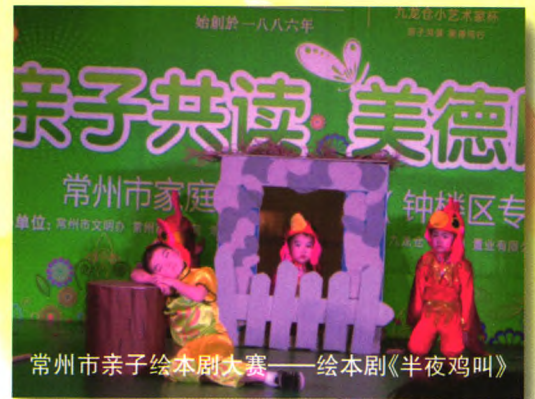
常州市亲子绘本剧大赛——绘本剧《半夜鸡叫》