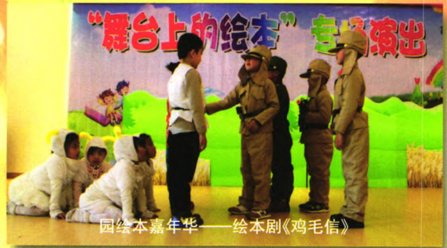
园绘本嘉年华——绘本剧《鸡毛信》

绘本剧表演是园所的一大亮点，幼儿以人偶表演为形式把绘本剧搬上舞台，表演时尽可能让每个孩子都能在节目中有角色担当参与演出，注重孩子们的参与与体验，关注的是孩子心灵成长的需求。在老师搭建的平台上，孩子们充分地展示自我，表达自我，在绘本世界里自由表述、自主表征、自信表演，促进了幼儿多元能力的发展。园所将执着追求“绘本润泽儿童的快乐童年”这一宗旨，不断创新，努力践行。