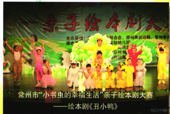
常州市“小书虫的幸福生活”亲子绘本剧大赛——绘本剧《丑小鸭》