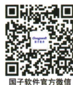
国子软件官方微信

地址：济南市高新区舜风路101号 齐鲁文化创意基地5号楼、6号楼 电话：0531-89701710、89701720、89701707、89701735、89701750 网站： www.googosoft.com