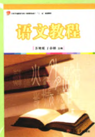
《语文教程》(第二版) 主编：苏艳霞 丁春锁