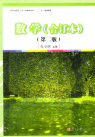
《数学(合订本)》 (第二版) 主编：孔宝刚

复旦大学出版社学前教育分社 地址：上海市国权路579号 邮编：200433 网址：fupnet@fudanpress.com http://www.fudanpress.com 学前教育_复旦社 QQ群：58955795 门市零售：86-21-65642857 团体订购：86-21-65118853 外埠邮购：86-21-65109143 学校购书：15800542581 (宋昌海) 13817252135 (谢丛深) 复旦大学出版社_学前教育分社官方微博： http://weibo.com/fudanxueqian