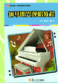
《钢琴即兴弹唱教程》 主编：潘如仪 陈云华