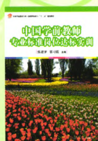
《中国学前教育专业标准岗位达标实训》 主编：张建岁 霍习霞