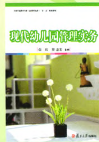
《现代幼儿园管理实务》 主编：张欣 程志宏