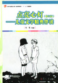
《点亮心灯——儿童文学经典伴读》 (修订版) 编著：苇苇