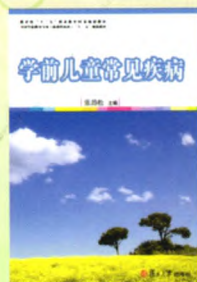
《学前儿童常见疾病》 主编：张劲松