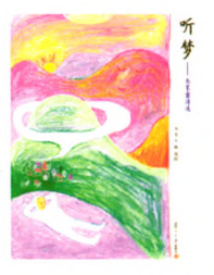
《听梦——韦苇童诗选》 韦苇 文 唐筠 图