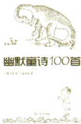
《幽默童诗100首》 蒲华清 文 吴庆渝 图