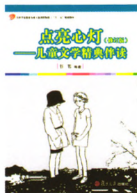
《点亮心灯——儿童文学精典伴读》(修订版) 韦苇 编著