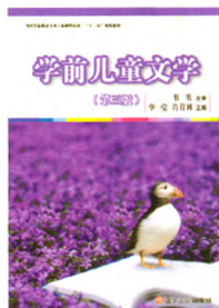
《学前儿童文学》(第三版) 韦苇 主审 李莹 肖育林 主编