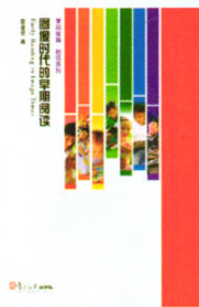
《图像时代的早期阅读》 陈世明 著