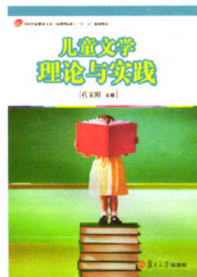
《儿童文学理论与实践》 孔宝刚 主编