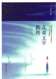
《儿童文学教程》 方卫平 著