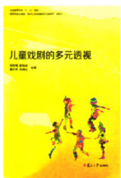
《儿童戏剧的多元透视》 陈世明 彭怡玢 合著 戴力芳 朱湘云