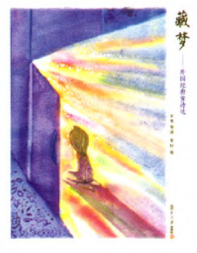
《藏梦——世界童诗选》 韦苇等译 苏打 图