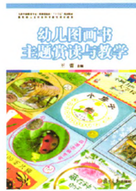
《幼儿图画书主题赏读与教学》 王蕾 主编