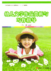
《幼儿文学作品赏析与写作指导》 吕明 主编