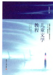
《儿童文学教程》 方卫平 著