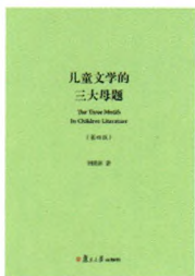
《儿童文学的三大母题》 刘绪源 著