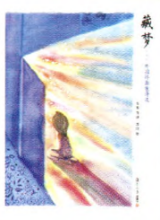
《藏梦——世界童诗选》 韦苇等译 苏打 图