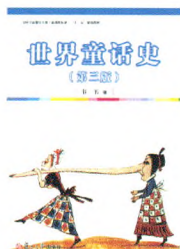
《世界童话史》(第三版) 韦苇 编著