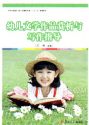
《幼儿文学作品赏析与写作指导》 吕明 主编