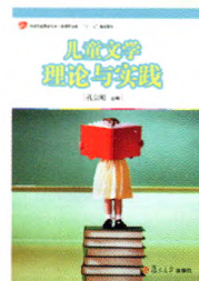
《儿童文学理论与实践》 孔宝刚 主编