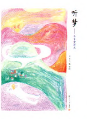
《听梦——韦苇童诗选》 韦苇 文 唐筠 图