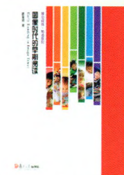
《图像时代的早期阅读》 陈世明 著