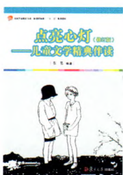
《点亮心灯——儿童文学经典伴读》 (修订版) 韦苇 编著