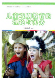
《儿童戏剧教育的理论与实践》 林玫君 著