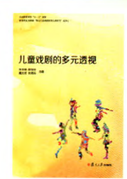
《儿童戏剧的多元透视》 陈世明 彭怡玲 戴力芳 朱相云 合著