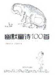
《幽默童诗100首》 蒲华清文 吴庆渝 图