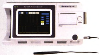
MD-480A 白内障超声乳化仪 国械注准20163230138