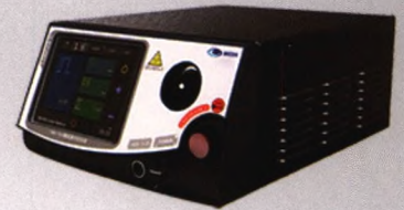
MD-1000A 眼科超声测量仪 国械注准20153231731