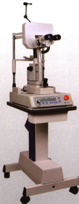
MD-300L 眼科超声生物显微镜 国械注准20163231075