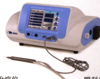
MD-2400S 眼科A/B型超声诊断仪 国械注准20153230090