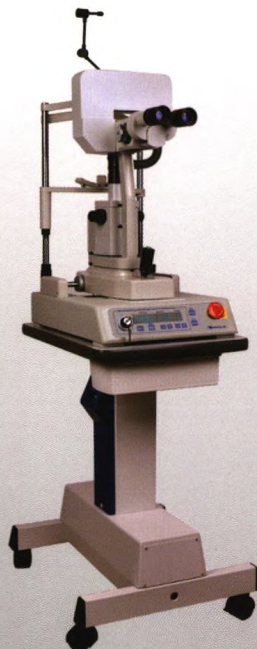
MD-300L 眼科超声生物显微镜 国械注准20163231075