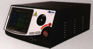
MD-1000A 眼科超声测量仪 国械注准20153231731