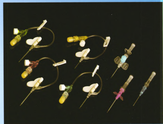
一次性使用留置针 I.V Catheter 国内产品注册证号: 国食药监械(准)字2010第3150950

上海康德莱企业发展集团股份有限公司 (KDL) 成立于1987年, 专业从事一次性医疗器械用品的生产、研发和销售, 是集科工贸为一体的跨国集团公司。KDL通过了ISO 9001, ISO 13485和CE认证以及美国FDA注册, 业务范围越来越广泛。目前, KDL总资产1亿美元, 年产值超过1.5亿美元, 拥有5,000名员工和21,000平方米的净化车间。KDL是中国医疗器械行业协会医用高分子制品分会理事长单位, 其年营业额及产业规模在中国医疗器械行业占据主导地位。