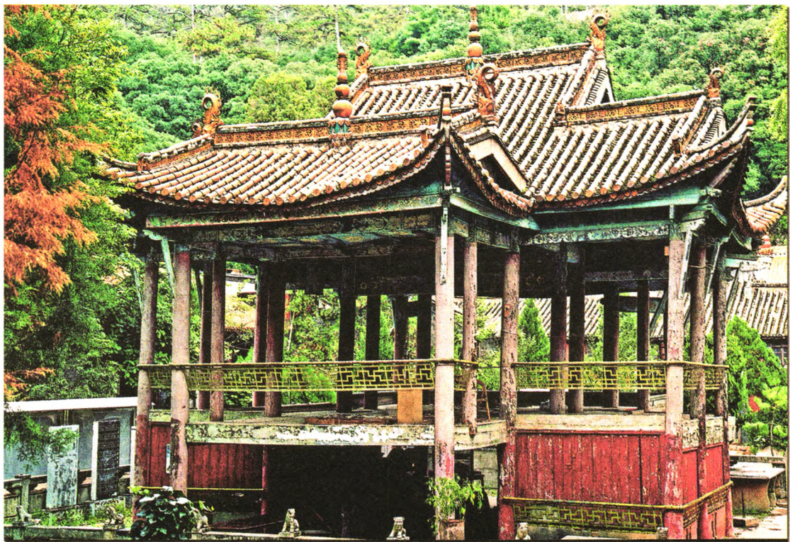
昭通市北闸镇大龙洞古戏台

省档案局召开推进落实州市四项重点任务 暨数字档案馆建设培训会议 辉煌之路启示录 文化名人在河南“五七干校”的尘封岁月 基于民生档案利用的公众档案意识再思考