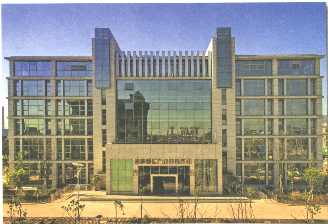
晋宁县国家综合档案馆