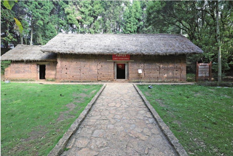
中国共产党云南第一次代表大会会议旧址