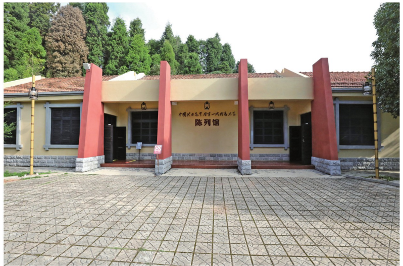
中国共产党云南第一次代表大会会址陈列馆