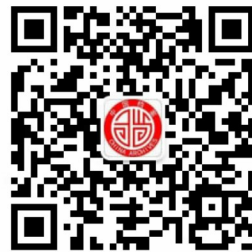
云南档案微信公众号

编委会主任:张文芝 主 编:张云辉 编 辑:王善铸 胡正刚 主 管:云南省档案局 主 办:云南省档案馆 出版发行:《云南档案》编辑部 地 址:昆明市西北北路 119 号 档案大厦 邮政编码:650032 电 话:0871-63992619 电子信箱:yndabjb@126.com yndag@126.com 刊 号:ISSN 1007-9343 CN53-1105/G2 赠阅范围:国家档案局中央档案馆 及其各司局、中国第一历史档案馆、 中国第二历史档案馆,各省、自治 区、直辖市档案局、档案馆;云南省 各州市县区档案局、档案馆,省直机 关档案部门、各高校档案馆、专业档 案馆、中央驻滇企业及省属企业 印 刷:云南民大印务有限公司 出版日期:双月 20 日