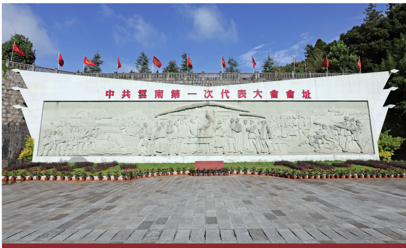
中国共产党云南第一次代表大会会址纪念墙（蒙自查尼皮村）