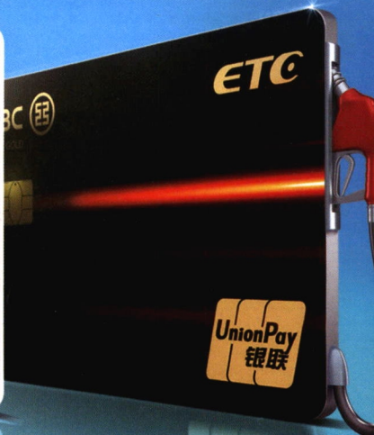
• 工银银联ETC信用卡(含速度与激情系列)