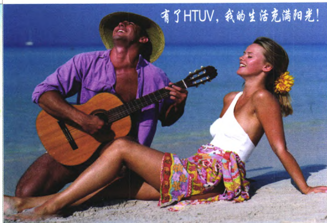
HTUV整理的纺织品符合各国防紫外线织物标准的要求。