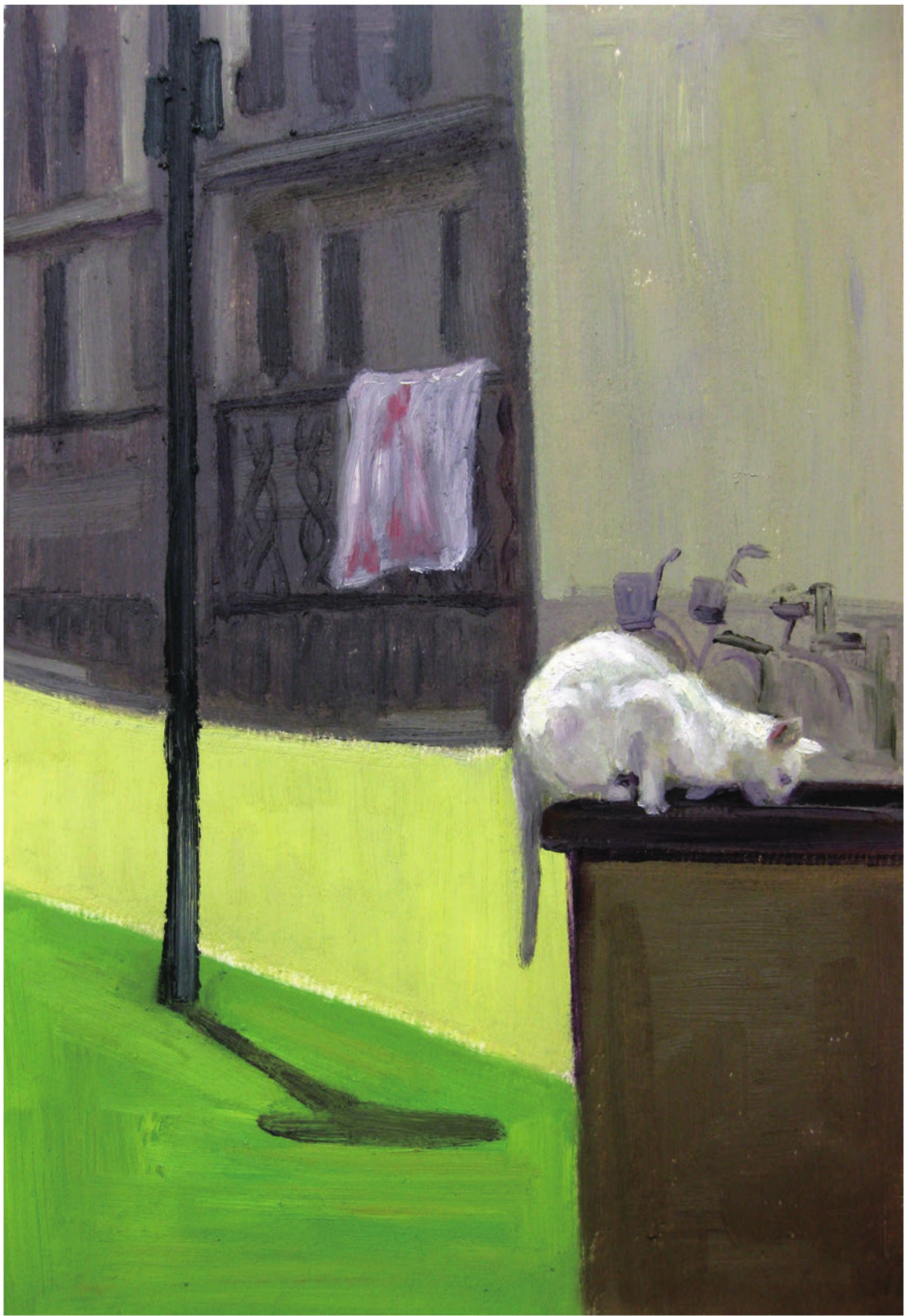
侯虹旭 猫的的日常 纸本油画 24 cm×35 cm 2012