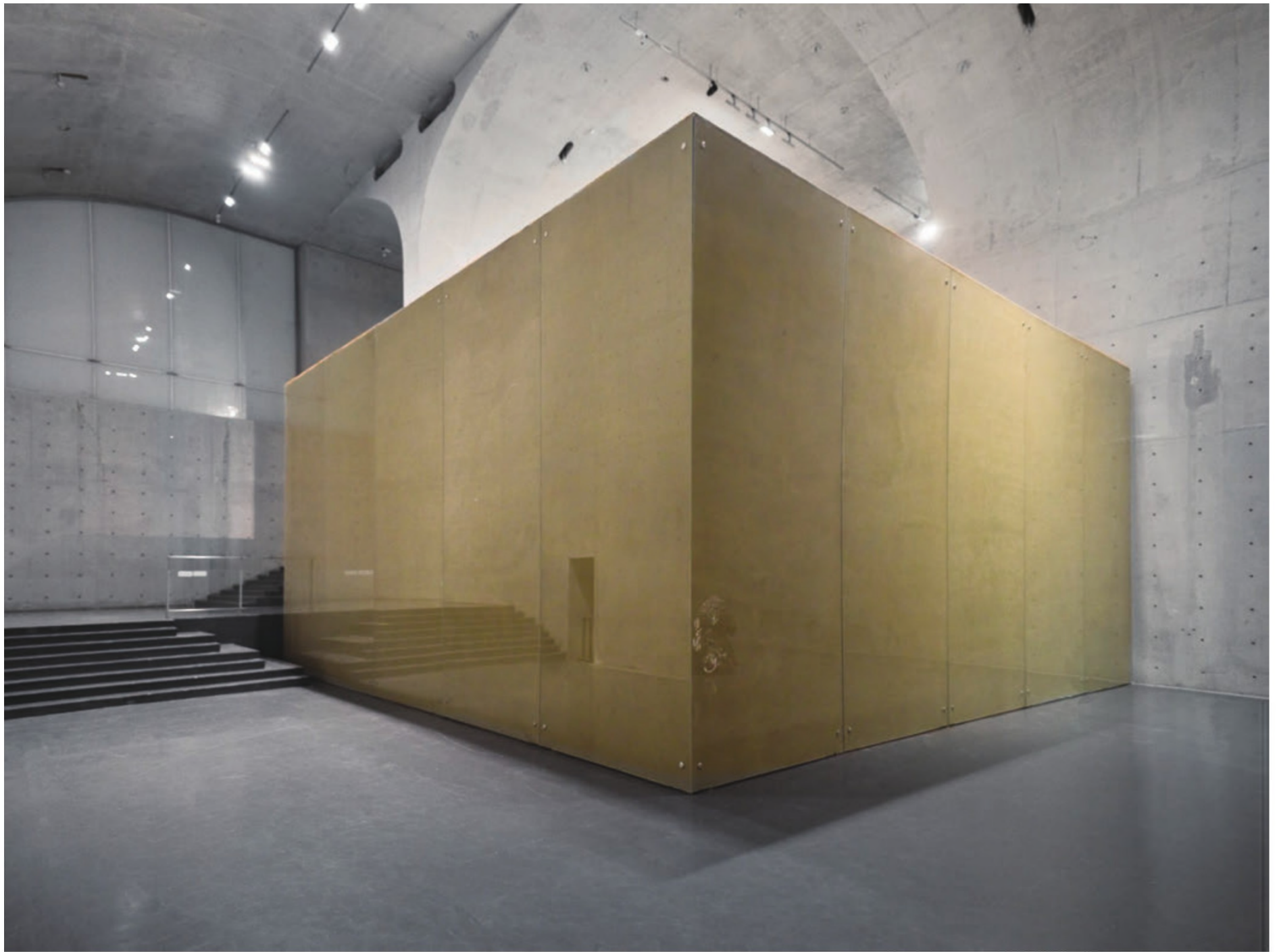
刘韡 1098.1吨沙漠 “刘韡：散场 / OVER” 展览现场 龙美术馆（西岸馆）2020