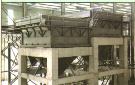
GXN防堵高效斜管浓密机

鑫鹰环保科技(湖北)有限公司 通讯地址：湖北省黄石市黄金山开发区大棋路281号 电话：4006622333、0714-3268866 传真：0714-3268800 网址： http://www.xinyingtec.com