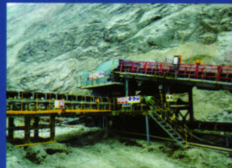
CT1627干选机 (首钢矿业公司东排采场)