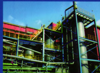
KYZ4315 (江西铜业集团泗州选厂)