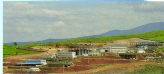
云南北衙金矿采选工程(1万吨/日)