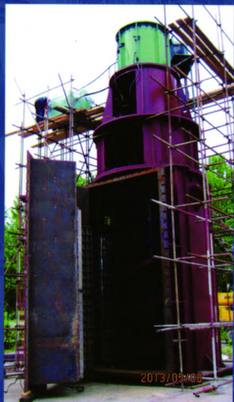
KLM630kW塔磨机 (新疆西成铁矿)