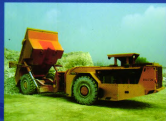
DKC20t井下卡车 (山东黄金焦家金矿)