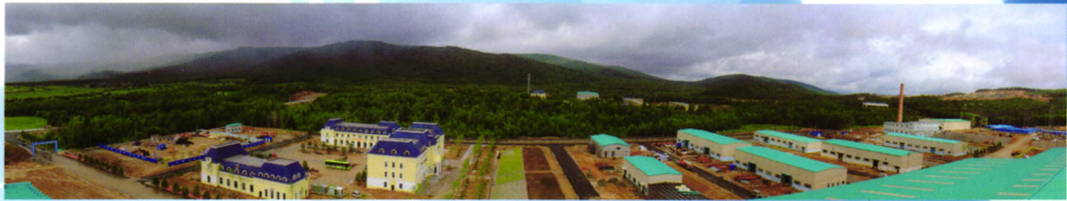
中铁资源黑龙江伊春鹿鸣钼矿采选工程(5万吨/日)