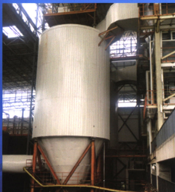
半干法脱酸反应塔