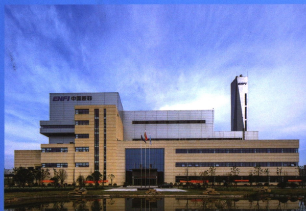
赣州市第二垃圾处理厂（焚烧发电厂）——BOT模式投资的环保项目，处理能力达 1200t/d，项目2019年投产。