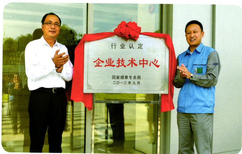
上海烟印“行业认定企业技术中心”揭牌