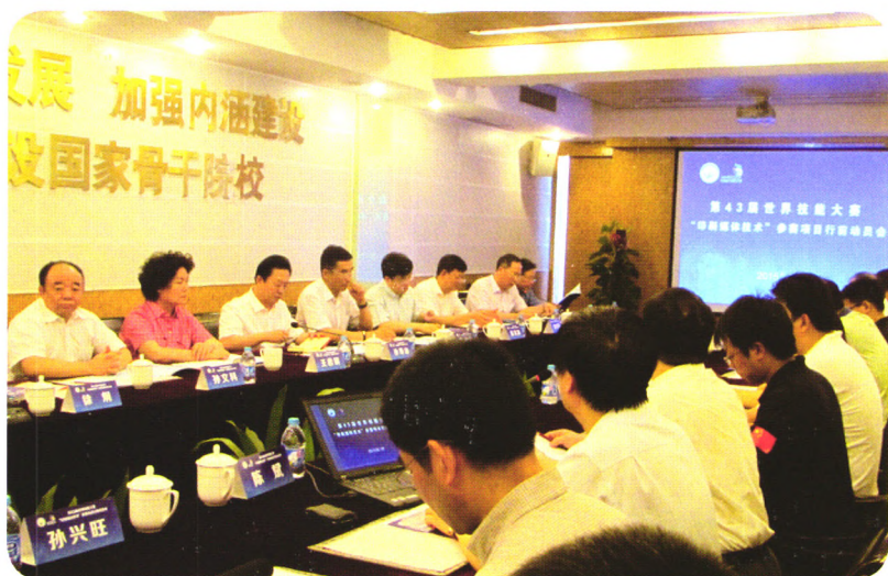
第43届世界技能大赛行前动员会在沪举行