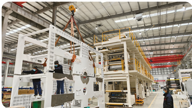
航天华阳坚持疫情防控与安全生产两手抓

印刷杂志 2022年第2期 (总第413期) PRINTING FIELD 50 1972—2022