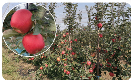
免套袋中晚熟新品种 馨元萃