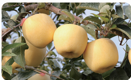
原种引进、严格把关、试栽引种 哈鲁卡 (维纳斯黄金)