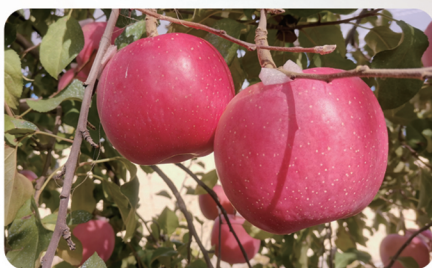
浓红型免套袋苹果新品种 双馨