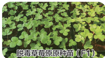
脱毒草莓原原种苗 (F1)