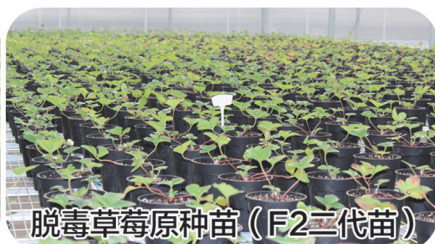
脱毒草莓原种苗 (F2二代苗)